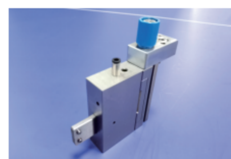
独立模具 Separate Tool