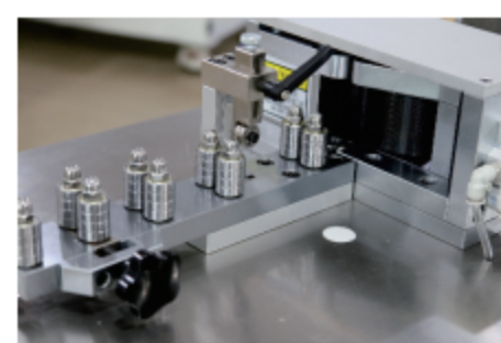
精密送料轨道 Feeding Part