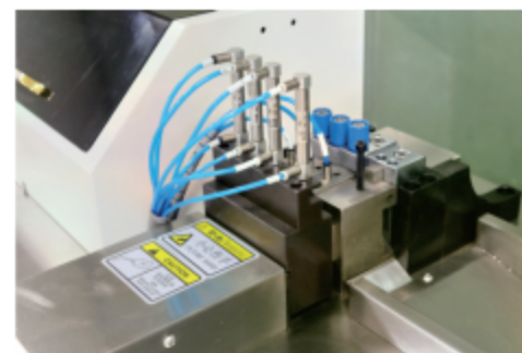
多功能冲切模组 Punch Tool